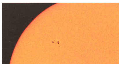
Kleines Intermezzo oder der Beginn des 24. Zyklus? Die SOHO-Aufnahme zeigt die Fleckengruppe am 2. Juni 2009.

Erwacht die Sonne nun doch aus ihrem Schlaf? Ende Mai, Anfang Juni 2009 (Bild unten) trat erstmals seit vielen Tagen und Wochen eine «grössere» Fleckengruppe auf. Ob nun der 24. Zyklus doch noch richtig in Gang kommt, werden die kommenden Wochen und Monate zeigen. Das ursprünglich auf die Jahre 2011/12 vorausgesagte Maximum dürfte nach den neuesten Prognosen erst 2015/16 auf tiefem Niveau zu erwarten sein. In der Grafik rechts ist zu sehen, dass die Vorhersagen im Oktober 2008 noch optimistischer waren.