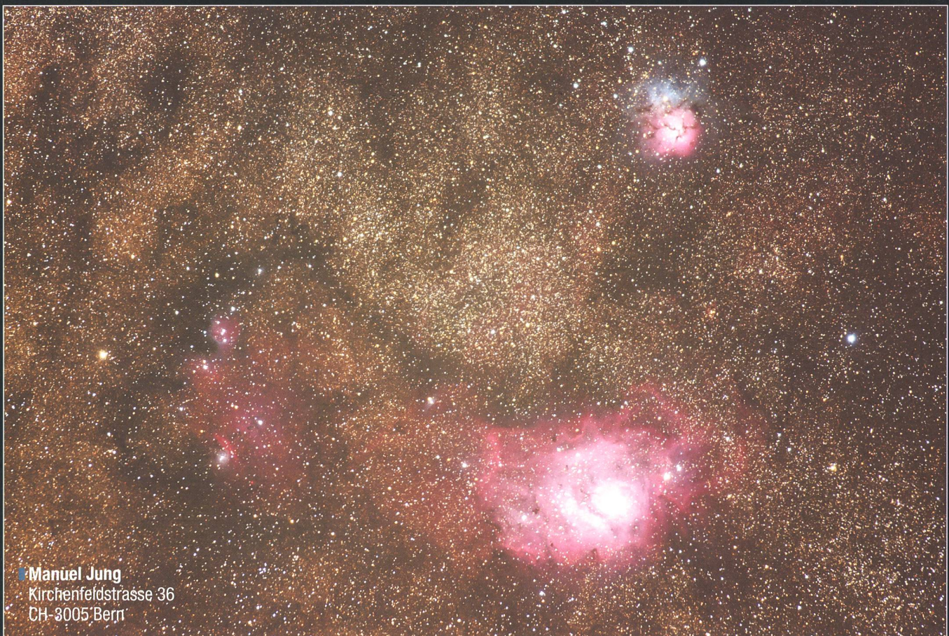
Manuel Jung Kirchenfeldstrasse 36 CH-3005 Bern