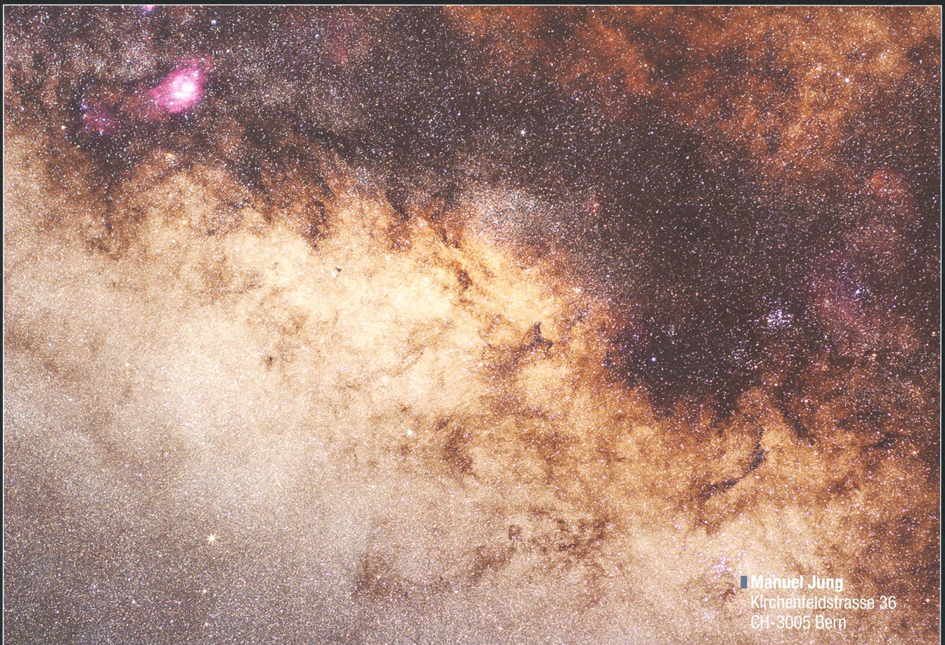
■ Manuel Jung Kirchenfeldstrasse 36 CH-3005 Bern