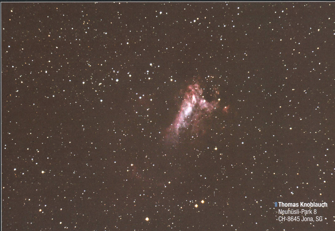
Thomas Knoblauch Neuhüsli-Park 8 CH-8645 Jona, SG