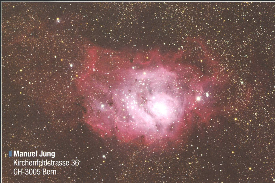
Manuel Jung Kirchenfeldstrasse 36 CH-3005 Bern

Von dunklen Standorten aus mit guter Sicht an den Südhimmel lässt sich bei sehr klaren Bedingungen diese Region dennoch ansprechend fotografieren. MANUEL JUNG zieht es oft auf den Gurnigelpass, wo er genau diese optimalen Verhältnisse vorfindet. Wie die beiden Aufnahmen, die untere eine weitwinklige mit dem Lagunennebel Messier 8 in der unteren Bildhälfte und dem etwas kleineren Trifidnebel Messier 20 im oberen rechten Bildsektor, zeigen, sind beeindruckende Bilder auch bei uns möglich. Bei beiden Objekten handelt es sich um eine Struktur aus Emissions- und Reflexionsnebel. Sie sind etwa 5200 Lichtjahre weit entfernt. Die lateinische Bezeichnung « trifidus » bedeutet «dreigeteilt». Bei genauem Hinsehen erkennt man eine dunkle Staubwolke, die den Trifidnebel durchzieht und dreiteilt.