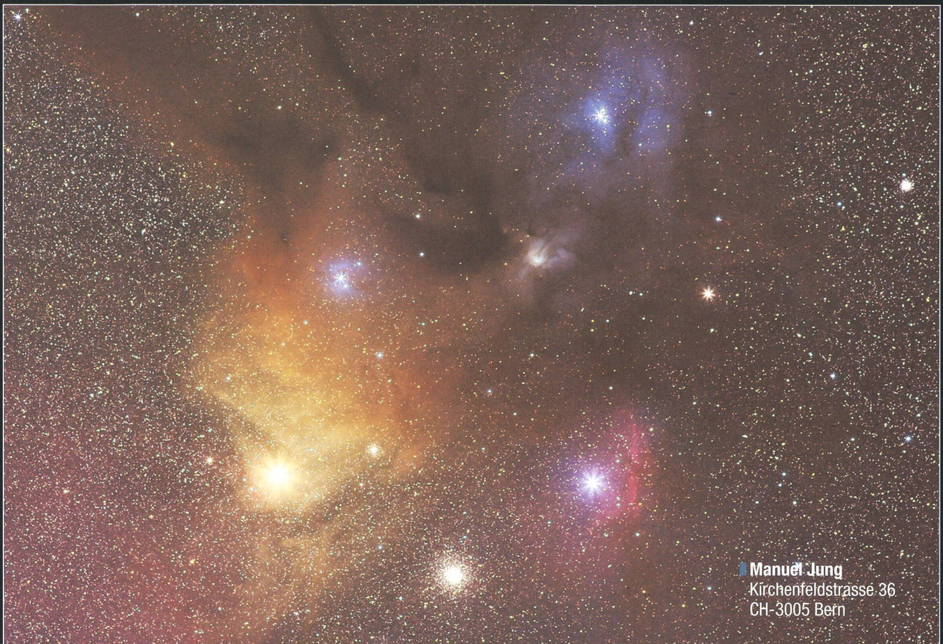
■ Manuel Jung Kirchenfeldstrasse 36 CH-3005 Bern