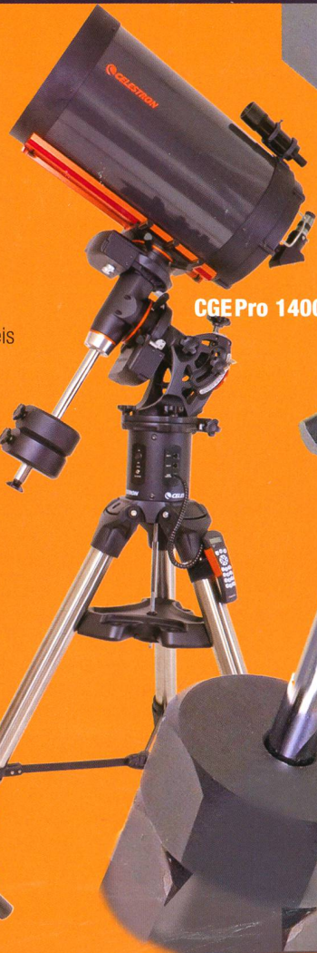
CGE Pro 1400