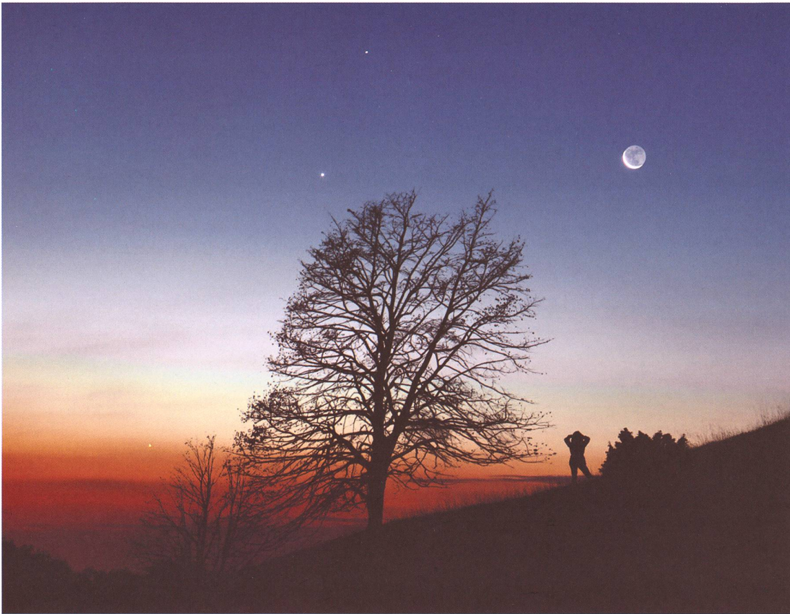
Diese Aufnahme der Konjunktion aus Mond, Merkur, Venus und Saturn entstand am 16. Oktober 2009. Verwendet wurde eine Canon EOS 5D Mark II mit einem 85mm-Objektiv, das auf Blende 1:3,5 abgeblendet wurde. Die Belichtungszeit betrug zwei Sekunden bei ISO 400. Die abgebildete Person wurde gebeten, sich während der Belichtungszeit nicht zu bewegen.