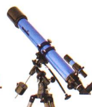
Skywatcher 90/900mm Refraktor auf EQ2 167,- €