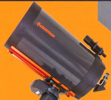
CGE Pro 1400