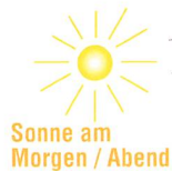
Abb. 3: Eigentlich hätten unsere Vorfahren merken müssen, dass eine scheibenförmige Erde nur um Mitternacht einen kreisrunden Schatten in den Raum werfen könnte. Kurz vor Sonnenauf- und nach Sonnenuntergang hätte dieser aber eine elliptische Form. (Grafik: Thomas Baer)