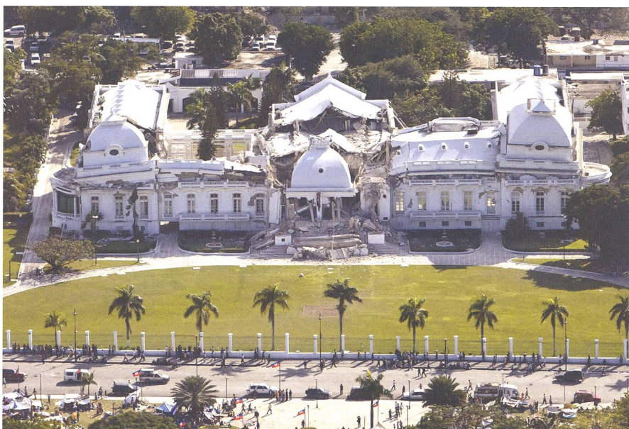
Der nach dem Erdbeben vom 12. Januar 2010 eingestürzte Präsidentenpalast in Port-au-Prince. Neumond war nur 2½ Tage später.