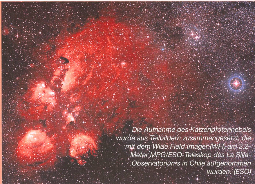
Die Aufnahme des Katzenpfotennebels wurde aus Teilbildern zusammengesetzt, die mit dem Wide Field Imager (WFI) am 2,2-Meter MPG/ESO-Teleskop des La Silla-Observatoriums in Chile aufgenommen wurden.