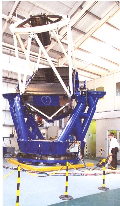
Das 25 Tonnen schwere Faulkes“-Teleskop ist mit seinen 20 Metern Brennweite eine gewaltige Sehmaschine.

Ich bin dann natürlich im Nachgang dieser spektakulären Beobachtungen von Freunden und Bekannten immer wieder gefragte worden, welche neuen Namen nun kommen werden. Doch es ist schlechter Stil, wenn man diese Namen schon bekannt gibt, bevor sie das strenge