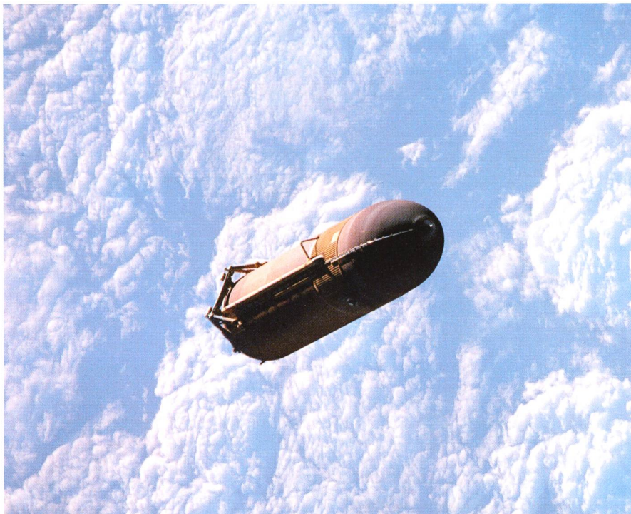
Der Aussentank schwebt vor imposanten Wolkengebilden langsam der Erde entgegen.