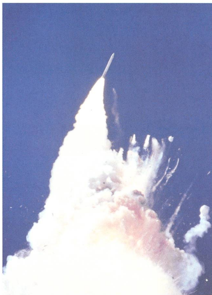
Rückschläge gab es für die NASA in den Jahren 2003 (oben) und 1986 (unten) als die beiden Raumfähren Columbia beim Wiedereintritt in die Erdatmosphäre und Challenger kurz nach dem Start verunglückten

vorgezogen hatte. Die Probleme mit den Dichtungsringen bei Minustemperaturen waren bekannt. Die Challenger stand 38 Tage bei Minustemperaturen auf der Startrampe. Am Starttag war es -4 Grad, es gab Eiszap-