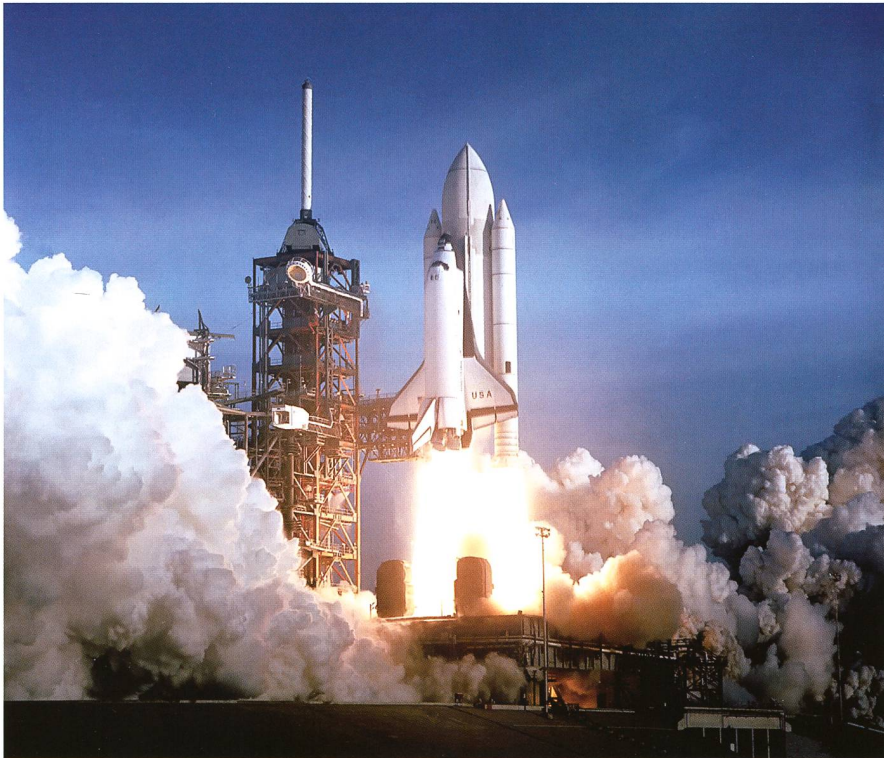
Der 12. April 1981 war ein historischer Moment für die NASA. Mit Columbia hob erstmals ein Space Shuttle von Cape Canaveral ab.

Mit dem vermutlich letzten Flug des Space Shuttle von Ende 2010 geht eine fast 40 Jahre dauernde Ära zu Ende. Ob und wie erfolgreich das gesamte Projekt war, ist schwierig zu beurteilen. Da sich die USA 1972 dazu entschieden, das Space Shuttle als weitgehend alleiniges Transportmittel für Raumtransporte zu entwickeln und zu betreiben, kann es mit keinem alternativen System verglichen werden.