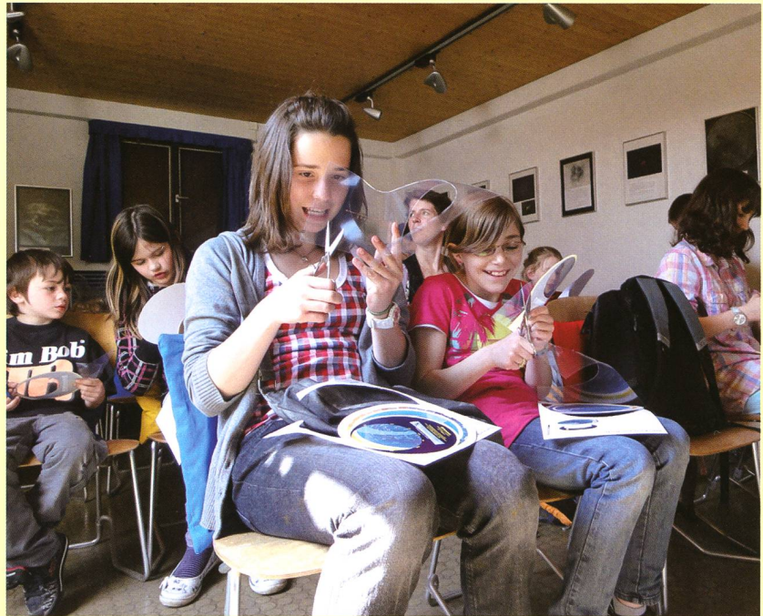
Kinder waren mit Feuereifer mit dabei beim Sternkartenbasteln. Die Astronomische Gesellschaft Winterthur stellte über 80 Bastel-Sets gratis zur Verfügung.