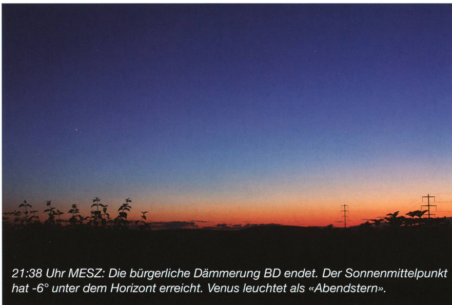
21:38 Uhr MESZ: Die bürgerliche Dämmerung BD endet. Der Sonnenmittelpunkt hat -6^\circ unter dem Horizont erreicht. Venus leuchtet als «Abendstern».