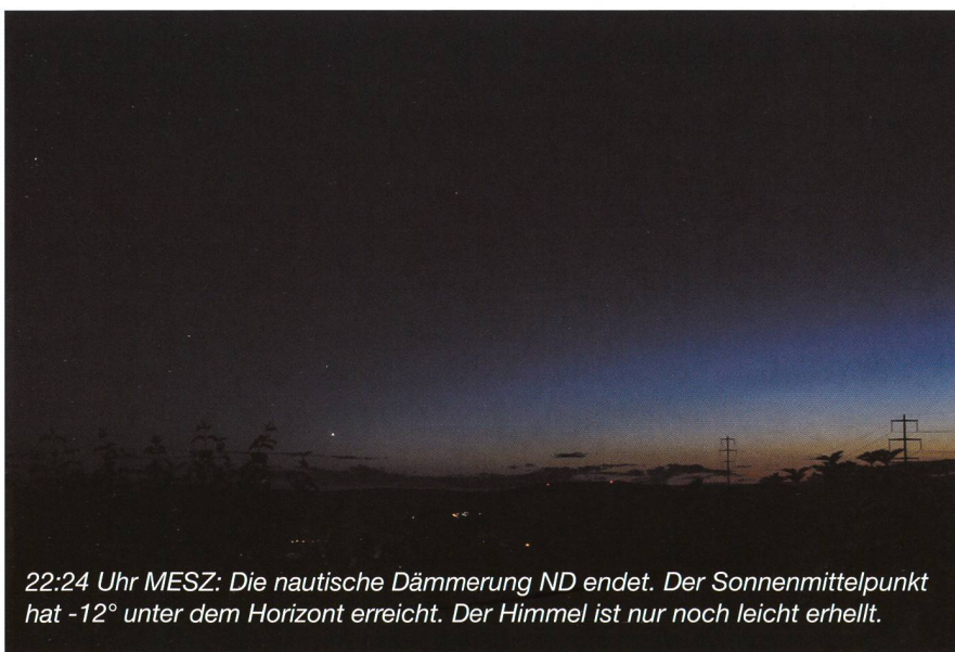
22:24 Uhr MESZ: Die nautische Dämmerung ND endet. Der Sonnenmittelpunkt hat -12^\circ unter dem Horizont erreicht. Der Himmel ist nur noch leicht erhellt.

Minuten. Man kann im Freien noch lange ein Buch oder eine Zeitung lesen, während der Himmel langsam dunkler wird und die hellsten Planeten, Venus und Jupiter sichtbar werden lässt. Am Ende der bürgerlichen Dämmerung werden für geübte Beobachter langsam Sterne 1. Grössenklasse sichtbar.