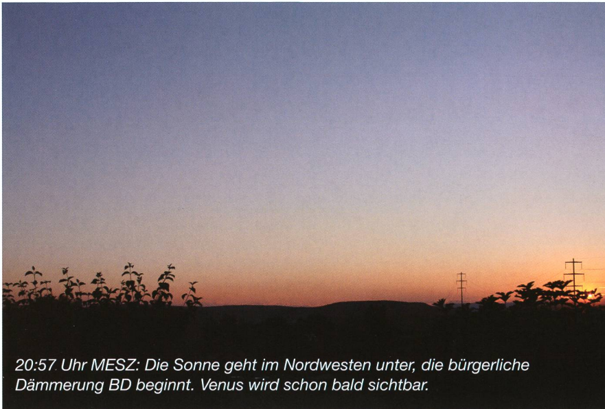
20:57 Uhr MESZ: Die Sonne geht im Nordwesten unter, die bürgerliche Dämmerung BD beginnt. Venus wird schon bald sichtbar.