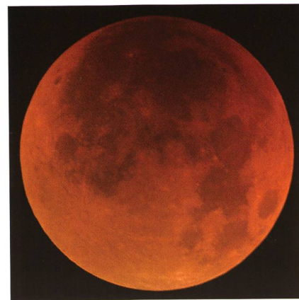
Die totale Mondfinsternis vom 15. Juni 2011 zählt mit einer Totalitätsdauer von 1 Stunde und 40 Minuten zu den längsten ihrer Art.

Fast zur Sommersonnenwende ereignet sich in den Abendstunden des 15. Juni eine ausgesprochen lange totale Mondfinsternis. Der Vollmond wandert praktisch zentral durch den Kernschatten der Erde! Einziger Wermutstropfen; die totale Phase beginnt exakt bei Sonnenuntergang, womit der Himmel erst im Laufe der Finsternis dunkler wird und der «rote Mond» ab Finsternismitte sichtbar werden dürfte. Die zweite Stunde der totalen Phase und