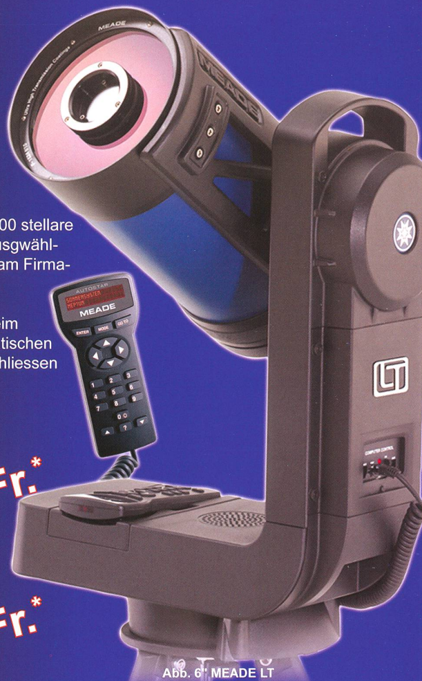
Abb. 6" MEADE LT

6" MEADE LT 2070,- SFr. jetzt: 1921,- SFr.* 8" MEADE LT 2810,- SFr. jetzt: 2661,- SFr.*