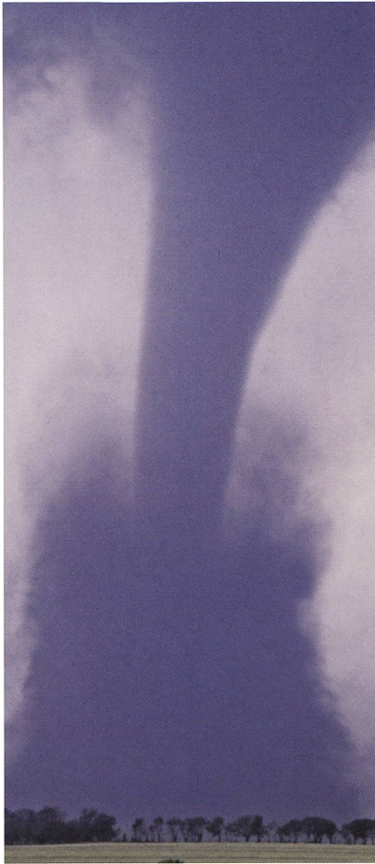
Aus der Basis einer Gewitterwolke südlich von Wichita (Kansas, USA) hat sich ein Tornado gebildet.

die durch den Menschen verursachte globale Erwärmung. Ebenso werden spektakuläre Licht- und Farbphänomene in der Atmosphäre, wie etwa Regenbogen, Polarlichter, Haloerscheinungen, Fata-Morganas usw. anschaulich dargestellt.