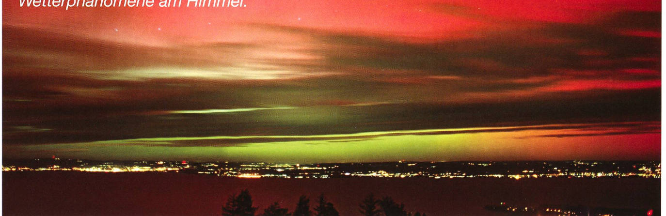
Rote und grüne Polarlichter erschienen am 30. Oktober 2003 über weiten Teilen von Europa infolge extrem hoher Sonnenaktivität. Im Bild ist der Bodensee vom Rorschacherberg aus zu sehen.

Das Wetter ist für alle Himmelsbeobachter ein wichtiges Thema. Ein neues Buch von ANDREAS WALKER und THOMAS BUCHELI gewährt einen verständlichen Einblick ins meteorologische Geschehen. Über 200 Bilder zeigen eindrucksvolle Wetterphänomene am Himmel.