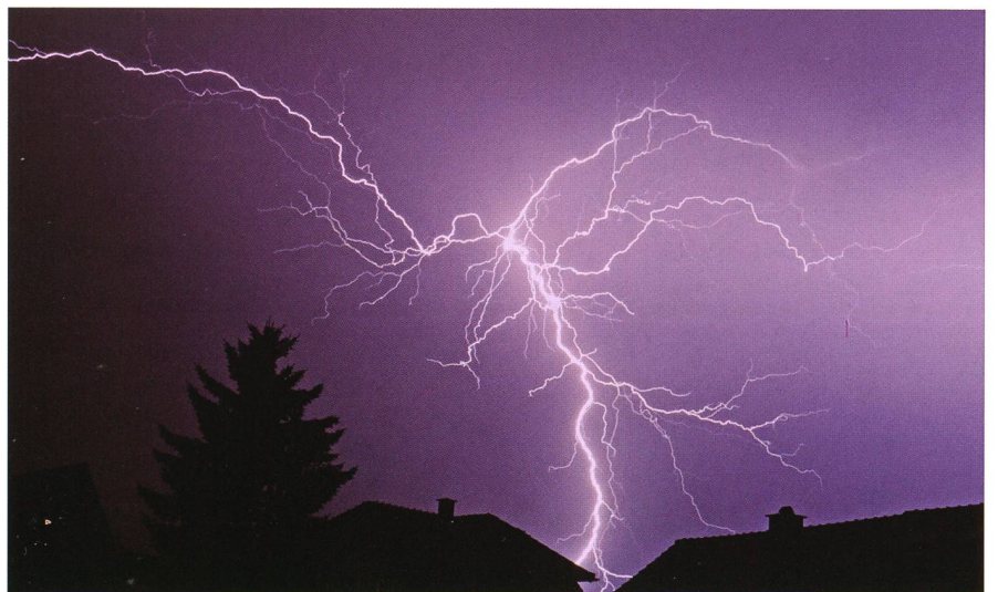
Hochspannung am Himmel. Ein verästelter Blitz fährt aus einer Gewitterwolke zur Erde nieder.

fach verständlich erklärt er die wichtigsten Grundbegriffe der Meteorologie, nämlich die verschiedenen Wolkengattungen, Luftdruck, Temperatur, Hoch- und Tiefdruckgebiete, Wetterfronten, Windsysteme, Stürme und Unwetter. Auch interessante mit dem Wetter ver-netzte Gebiete werden beleuchtet, wie etwa die Wetterfähigkeit und