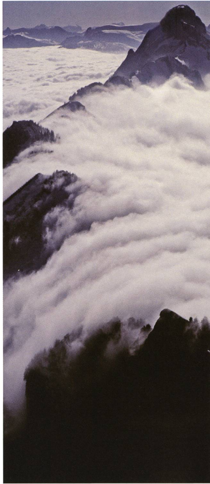
Die Kaltluft, durch Nebel gut sichtbar, fliesst wie ein Wasserfall den Berg hinunter (Standort: Hoher Kasten, Alpstein).

die durch den Menschen verursachte globale Erwärmung. Ebenso werden spektakuläre Licht- und Farbphänomene in der Atmosphäre, wie etwa Regenbogen, Polarlichter, Haloerscheinungen, Fata-Morganas usw. anschaulich dargestellt.