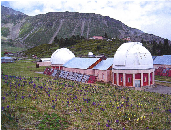
Abbildung 1: Das Observatorium in den Tian Shan Bergen.

Der folgende Bericht beschreibt ein einzelnes Element aus dem 2007 gestarteten internationalen Projekt IHY2007 (International Heliophysical Year 2007) der Vereinten Nationen. A. O. BENZ hat in der ORION-Ausgabe 341 darüber berichtet. Inzwischen werden die Projekte unter der Bezeichnung ISWI (International Space Weather Initiative) durch die UN und die NASA zur Förderung von Entwicklungsländern weiter geführt und politisch gefördert. In meinem Fall hat die SSAA (Swiss Society for Astrophysics and Astronomy) das Projekt finanziell unterstützt.