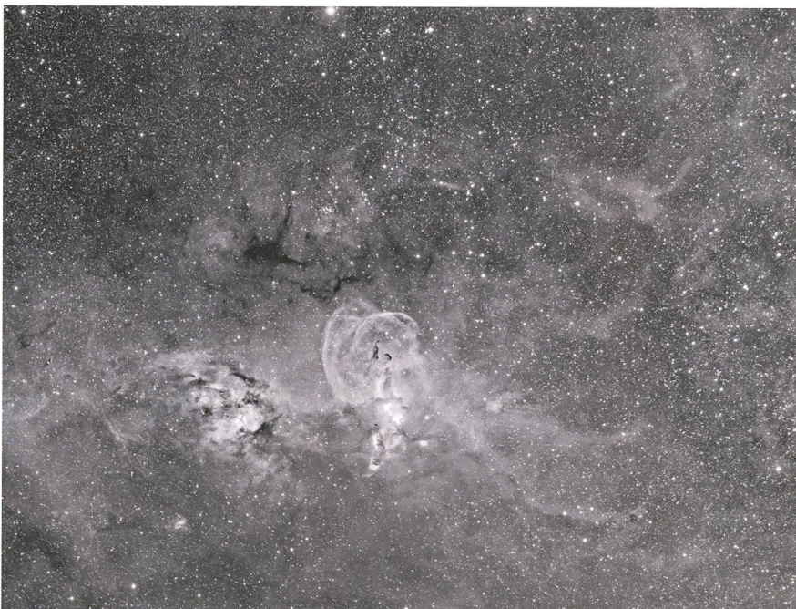
Abbildung 6: NGC 3576 Emissionsnebel im Sternbild Kiel des Schiffs, 10x10 Minuten belichtet mit FLI ML 8300M und Baader H-alpha Filter 7 nm am FSQ-106ED-Refraktor bei f/5.0.

send mit QuickTime mit einer Bildwiederholungsrate von 30 Bildern pro Sekunde zum Film gerechnet. Falls die Zeitrafferaufnahmen vor Sonnenuntergang gestartet oder nach Sonnenaufgang beendet wurden, müssen die Helligkeitsschwankungen während des Dämmerungsverlaufes zum Beispiel mittels einer Deflickering-Funktion herausgerechnet werden. Zum so korrigier-