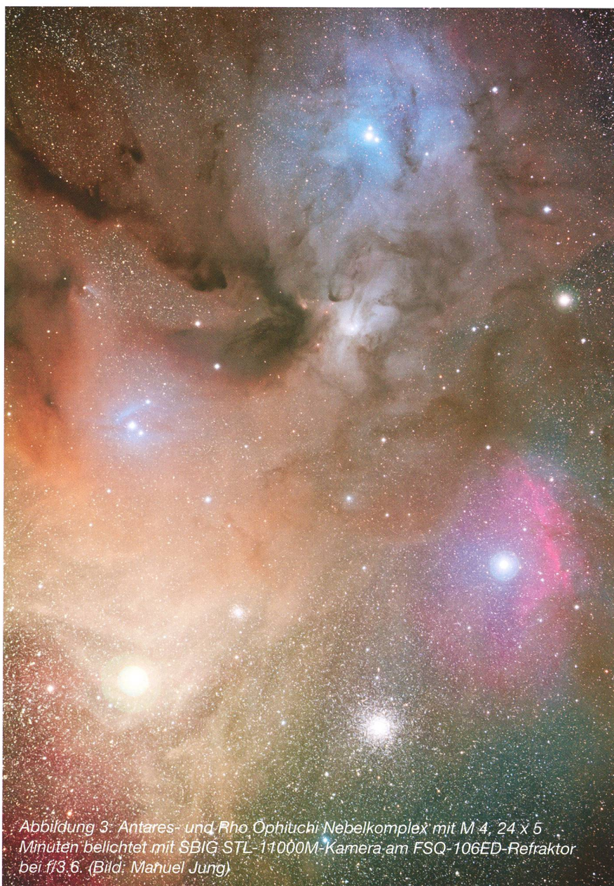
Abbildung 3: Antares- und Rho Ophiuchi Nebelkomplex mit M 4, 24 x 5 Minuten belichtet mit SBIG STL-11000M-Kamera am FSQ-106ED-Refraktor bei f/3.6.