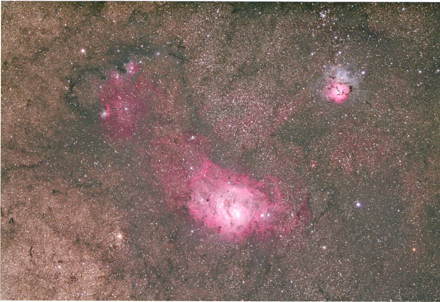
Abbildung 5: Lagunennebel (M 8) und Trifidnebel (M 20) mit Umgebung, 29x5 Minuten belichtet mit Canon EOS 5d Mark II (Hutech modifiziert) am FSQ-106ED-Refraktor bei f/5.0 bei 800 ASA.

Die Bildbearbeitung erfolgte nach Rückkehr in die Schweiz an einem schnelleren Rechner als dem mitgeführten Netbook. Dazu wurde neben dem Weissabgleich, der Helligkeit und der Gradationskurve auch die Vignettierung des Weitwinkelobjektives am Vollformatchip korrigiert. Die korrigierten Bilder wurden als jpg-Dateien im Full-HD-Format abgespeichert und anschlies-