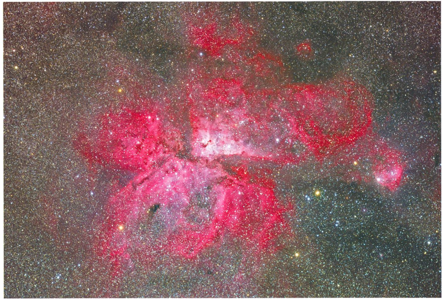
Abbildung 2: Eta Carinae Nebel (NGC 3372), 30x5 Minuten belichtet mit SBIG STL-11000M-Kamera am FSQ-106ED-Refraktor bei f/5.0.

lich für das Verschwenken von Leitrefraktoren gedachte Zubehörteil ermöglicht das präzise Verstellen eines der beiden Refraktoren gegen den anderen. Damit konnten die Refraktoren je nach Situation entweder genau parallel ausgerichtet oder auch leicht gegeneinander verstellt werden, um z.B. mit der FLI ML 8300M Kamera innerhalb desselben Himmelsobjekts auf ein anderes Bilddetail zu fokussieren als mit der SBIG STL-11000M.