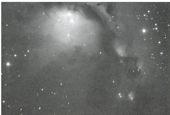
Abbildung 2: Der McNeil Nebel südwestlich von M 78, 26.12.2011, 6 Aufnahmen zu 300 s mit CCD-Kamera ST8XME am SCT Celestron 9 ¼ fokal von Willisau aus. M 78 ist der helle Nebel oben im Bild. Norden ist oben, Osten links.