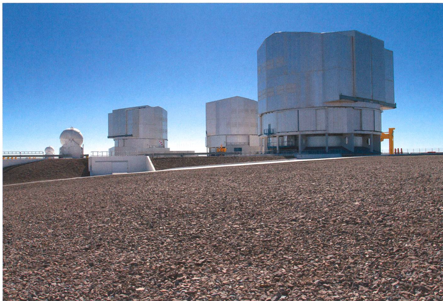
Figure 2: Les télescope du Very Large Telescope (VLT) ainsi que les télescopes auxiliaires.

vons enfin facilement nous repérer et reconnaissons sans problème les constellations et différents objets. A proximité de San Pedro, nous constatons au loin au milieu de la chaîne de montagne une sorte d'usine. En fait il s'agit du site de construction du radio-télescope ALMA. Il est malheureusement impossible de visiter le site de l'observatoire (qui se situe à 5000m) mais nous passons devant l'entrée. Les premières observations ont débuté à l'automne 2011 et le télescope devrait être entièrement opérationnel à la fin 2012.