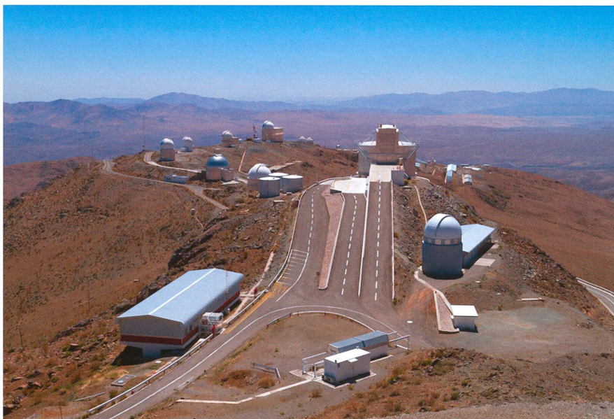
Figure 1: Vue générale (depuis le télescope de 3.6m) de l'observatoire de La Silla. En avant plan, les coupôles Suisse et du New Technology Telescope (NTT)

Pour tout astronome amateur avoir la possibilité un jour de découvrir le ciel de l'hémisphère sud dans la mythique région de l'Atacama au Chili constitue certainement un rêve. J'ai eu la chance à l'automne dernier de partir avec deux amis pendant un peu plus de trois semaines à la découverte des splendeurs du ciel Sud et des grands observatoires astronomiques chiliens.