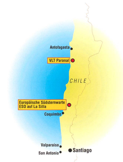
Figure 3: Carte du Chili et les grands observatoires.