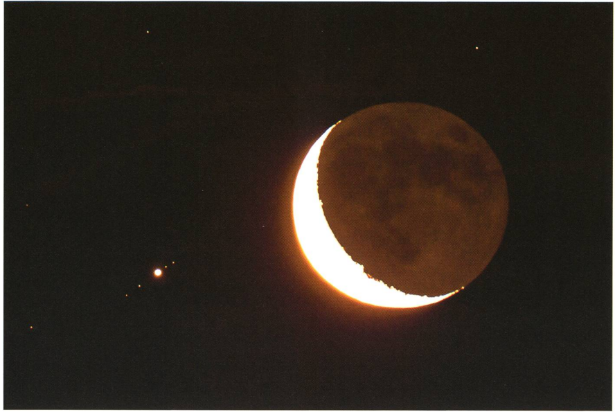
Abbildung 7: Mond und Jupiter kurz vor der Bedeckung; 15.07.12, 02:55 Uhr MESZ. Ausrüstung wie bei Bild 5, 2 s bei 1600 ASA. Der Mond ist wegen der geringen Höhe über dem Horizont kupferrot verfärbt; oben rechts Omega Tauri (4.9 mag ).

Zwischen dem ersten und zweiten Kontakt mit Jupiter gab es wieder eine Wolkenlücke, die ich für die visuelle Beobachtung nützte. Dann begann es unerwartet und heftig zu regnen! Eine improvisierte Abdeckung musste genügen, um die Instrumente trocken zu halten, denn weitere Löcher in der Wolken- decke standen in Aussicht. Kurioserweise befand sich eine besonders grosse, trotz Regens, genau über dem Beobachtungsstandort! Wieder tauchte der Mond auf, und einige Fotos entstanden sogar bei