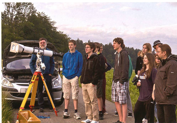
Abbildung 6: Zufriedene Gesichter unmittelbar nach der Beobachtung des Venusdurchgangs am 6. Juni 2012. Auf dem Refraktor ist eine Filtervorrichtung mit je einem visuellen und fotografischen Sonnenfilter montiert. Die Autobatterie versorgt die Nachführung mit Strom

Eigentlich hätte ich nicht gedacht, dass die Dramatik des Wetters anlässlich des Venusdurchgangs noch zu steigern sei. Doch sie war es! Auf dem Plan stand die Bedeckung Jupiters und seiner Monde durch den Erdtrabanten am frühen Morgen des 15. Juli 2012. Die dünne Mondsichel versprach günstige Bedingungen, doch wiederum waren die Wetterprognosen entmutigend und der vorabendliche Blick an den Himmel ernüchternd. Um 02:00 Uhr MESZ gab es einen Viertel freien Himmel, also musste die Aktion trotz ungünstiger Aussichten starten. Für einen tiefen Nordosthorizont war Dislozieren ins benachbarte Buchberg, Kanton Schaffhausen, angesagt. Bis die Instrumente aufgebaut waren, hatte sich der Himmel aber wieder