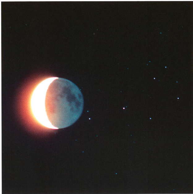
Abbildung 2: Ende der Bedeckung der Plejaden durch den Mond, 18. Juli 1990. Pentax 200mm-Objektiv bei f2.8; 120 Sekunden auf Kodachrome 64. Der Mond hat sich während der Belichtungszeit merklich gegenüber den Sternen verschoben.

ihn zu beschneiden; bei kleineren Sensoren vermindert sich die Maximalbrennweite entsprechend. Selbstverständlich sind auch Aufnahmen bei weitaus längeren Brennweiten möglich, doch haben dann nicht mehr beide Himmelskörper gesamthaft Platz.