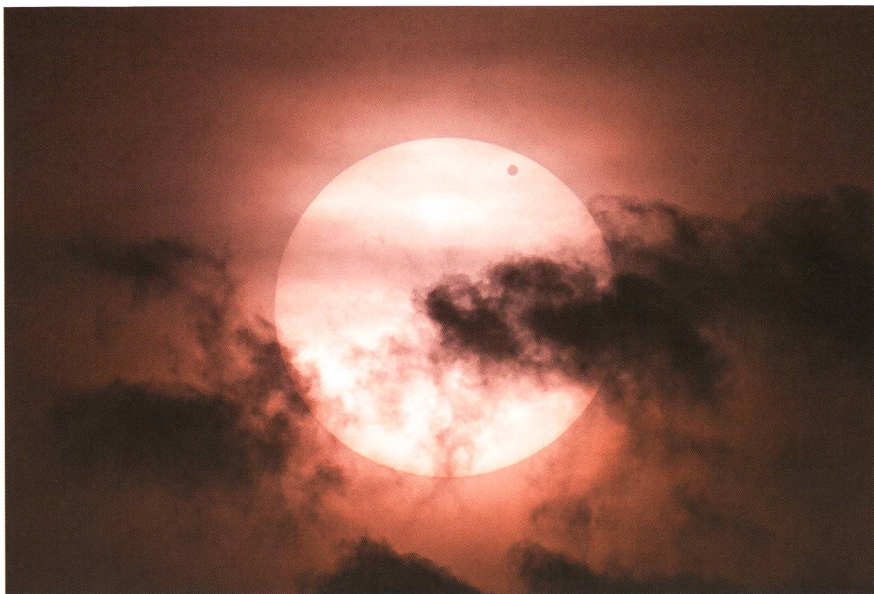
Abbildung 5: Venus während des Durchgangs durch die Sonne am 6. Juni 2012, 06:18 Uhr MESZ, Canon EOS 5DII an Meade 5 Zoll-Apo-Refraktor, f9; 1000x-Filterfolie, Standort südlich Schul- und Volkssternwarte Bülach.

weniger günstig: Nach Sonnenaufgang um 04:46 Uhr MESZ war nur die letzte Phase bis 06:55 Uhr MESZ (vierter Kontakt) theoretisch sichtbar, wobei mit «Theorie» das Wetter gemeint ist. Bei klarem Himmel bestand immerhin die Aussicht auf Bilder der dunklen Venus vor einer rot aufgehenden Sonnenscheibe. Eine Auslandsreise in ein Gebiet mit längerer Sichtbarkeitsdauer zog ich unter anderem deshalb nicht in Betracht, weil ich in jener Woche an meiner Schule, der Kantonsschule Zürcher Unterland, eine so genannte «Projektwoche» zum Thema Astronomie leitete.