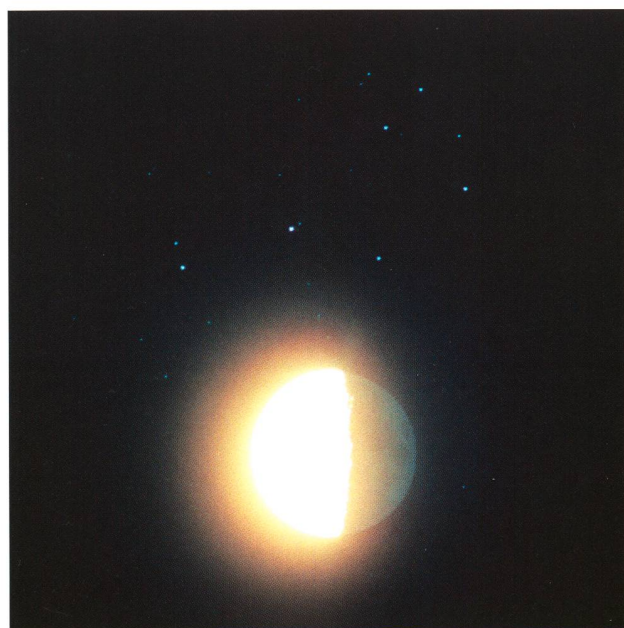
Abbildung 3: Naher Vorübergang des Mondes an den Plejaden am 1. September 1991. Pentax 200mm-Objektiv bei f2.8; 30 Sekunden auf Kodachrome 64. Trotz des mehr als halbvollen Mondes ist das Erdlicht erkennbar.

Noch vor einem Jahrzehnt waren analoge Aufnahmen auf feinkörnigen, aber auch niedrig empfindlichen Film bei Mond- und Planetenaufnahmen die Norm. Bei den gezeigten Bildern von Plejadenbedeckungen (Abbildungen 2 und 3) kam der legendäre Kodachrome 64 zum Einsatz. Die Bilder sind Ausschnittsvergrösserungen von Aufnahmen mit einem 200mm-Teleobjektiv mit einem Öffnungsverhältnis (Maximalblende) von 2.8. Bild 2 wurde länger belichtet als Bild 3, um das Erdlicht gut sichtbar zu machen. Trotz der relativ geringen Brennweite der Optik machte sich während der zweiminütigen Belichtungszeit die relative Bewegung des Mondes bemerkbar (nachgeführt wurde mit siderischer Rate, also auf die Sterne). Man kann die leichte Unschärfe des Mondes also als «Bewegungsunschärfe» deuten, die durch die Umdrehung um die Erde zustande kam. Mit modernen digitalen Spiegelreflexkameras sind bei guter Nachbearbeitung und Verwendung des RAW-Formats Empfindlichkeitseinstellungen bis weit über 1000 ASA möglich, wodurch Probleme mit der Mondbewegung weitgehend vermeidbar sind (vergleiche zur Bearbeitung von RAW-Daten den Beitrag in Orion 371, «Astro-Landschaftsfotografie mit Ultraweitwinkel-Objektiven»). Bilder von Plejadenbedeckungen gelingen bei grossen Phasenwinkeln des Mondes besser, also kurz