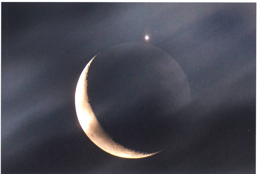
Abbildung 8: Nach dem Bedeckungs-ende Jupiters am 15. Juli 2012 um 04:22 Uhr MESZ, 5 s bei 1250 ASA. Neben Jupiter Europa und Io (näher beim Planeten). Durch die lange Belichtungszeit wirkt sich die Bewegung der Wolken bildwirksam aus.

■ Dr. Jürg Alean Rheinstrasse 6 CH-8193 Eglisau jalean@stromboli.net