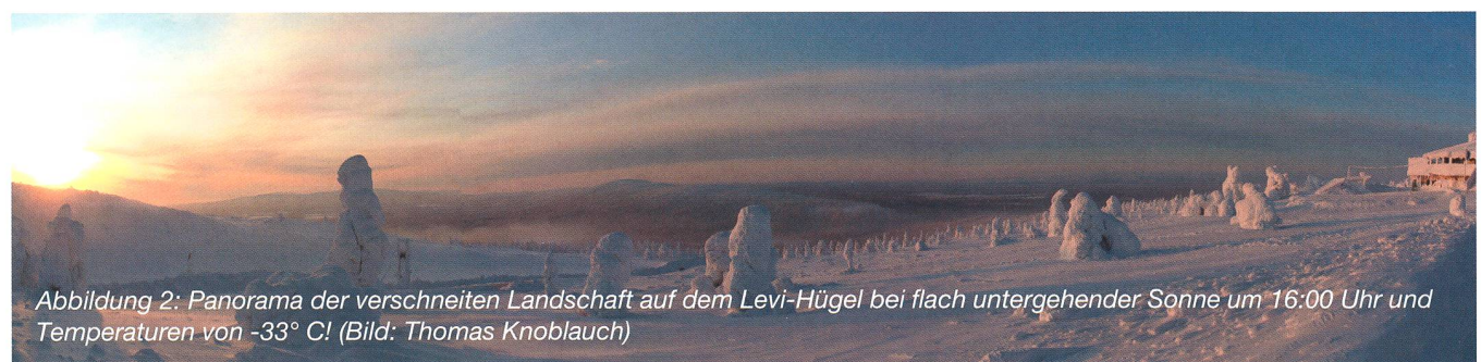
Abbildung 2: Panorama der verschneiten Landschaft auf dem Levi-Hügel bei flach untergehender Sonne um 16:00 Uhr und Temperaturen von -33^{\circ}\text{C} !

Die Fotografie von Polarlichtern ist nicht schwierig, doch können folgende Punkte zum Gelingen helfen. Für Aufnahmen sind folgende Parameter eine gute Anfangsgröße: 2-8