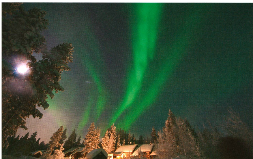
Abbildung 4: Polarlichter über Levi, Finnland, am 30. Januar 2012 um 21:29 Uhr. Brennweite: 8 mm, Objektiv: Sigma 8-16 mm, Kamera: Canon 350d, Belichtungszeit: 13s bei 800 ASA und Blende 4.5.

nahmen findet man auf den Internetseiten www.suedstern.ch und www.sternwarte-toggenburg.ch .