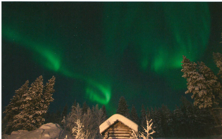
Abbildung 3: Polarlichter über Levi, Finnland, am 30. Januar 2012 um 21:12 Uhr. Brennweite: 10 mm, Objektiv: Canon 10-22 mm, Kamera: Canon 350d, Belichtungszeit: 10s bei 800 ASA und Blende 4.0.

Die Temperaturen in den Polarregionen liegen nicht selten bei -20^{\circ}\text{C} . In einem Tiefkühler kann die Tauglichkeit einer Kamera getestet werden. Für eine schnelle Adaption nach dem Tiefkühler packt man die eingeschaltete Kamera in einen verschliessbaren Plastik-Beutel. Über einen Fernauslöser aktiviert man die Kamera nach ca. 1-2 Stunden kühlen. Wenn die Kamera nach rund 1-2 Stunden noch auslöst, wird diese mit grosser Wahrscheinlichkeit auch in den kalten Polarregionen ihren Dienst tun. Zeitrafferaufnahmen einiger hier gezeigter Bilder und weitere Auf-