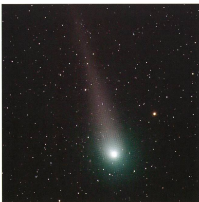
In den letzten Jahren waren viele Kometen, hier Lulin, für Europa nur Feldstecherobjekte.

Venus strahlt im Grössten Glanz als «Abendstern» nach Sonnenuntergang.