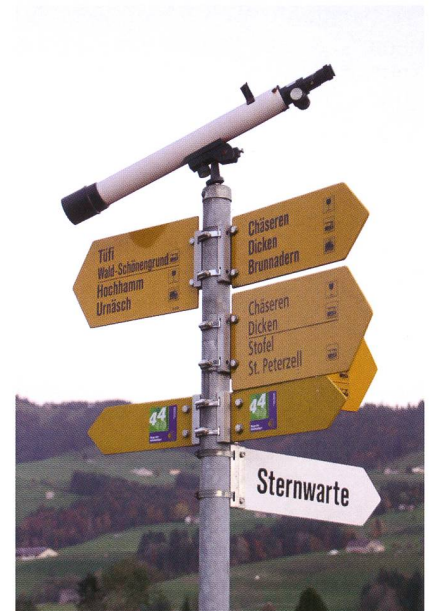
Abbildung 2: Ein besonderer Wanderwegweiser in der Nähe der Sternwarte.

Die drei Inhaber sind heute noch regelmässig beim Beobachten und Astrofotografieren in ihrer Sternwarte anzutreffen. Das Jubiläum haben die Betreiber absichtlich an