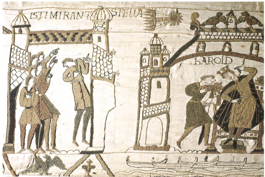
Abbildung 2: Der Komet von 1066 auf dem Teppich von Bayeux. Auf dem 68,38 Meter langen und 52 Zentimeter hohen Tuchstreifen wird die Eroberung Englands durch den Normannenherzog WILHELM DEN EROBERER dargestellt.

Unter den Vorsokratikern finden sich im antiken Griechenland differenzierte, doch insgesamt recht unterschiedliche Vorstellungen vom We-