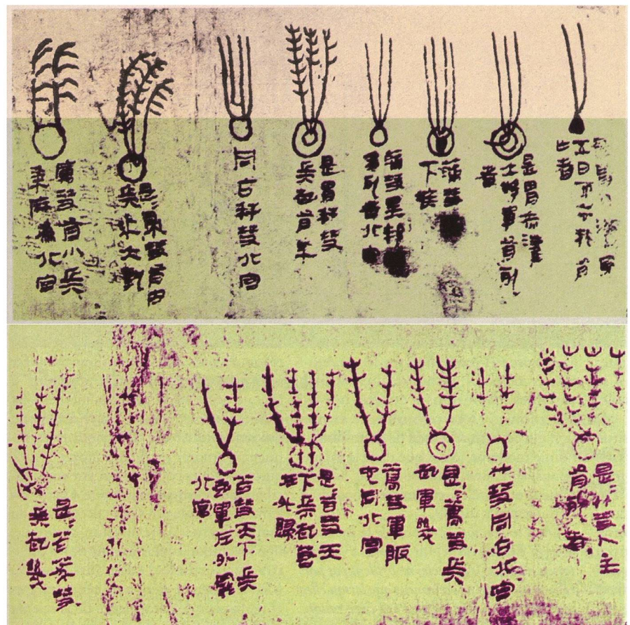
Abbildung 3: Haarsterne und ihre Bedeutungen aus dem „Kometenatlas“ von Mawangdui, China

kehrend. ARISTOTELES (384 – 322 v. Chr.) siedelt hingegen die Kometen nicht im translunaren Bereich draussen im Weltall an. Er betrachtet sie als meteorologische Erschei-