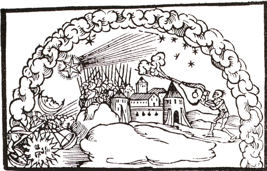
Abbildung 4: Auf einer Kometenschrift von 1532: Ein Schmid versucht mit seinem Blasebalg das drohende Kometenfeuer auszublase, während im Hintergrund bereits ein Kriegsheer naht.

nungen, die sich folglich im sublunaren Bereich abspielen müssen; als irdische Ausdünstungen, die nach oben steigen und Feuer fangen, wenn sie dort auf heisse, trockene Substanzen treffen. Mit seiner Naturlehre prägt er später die Lehrmeinung der christlichen mittelalterlichen Kirche, und bis in die Renaissance hinein auch die Naturwissenschaft.