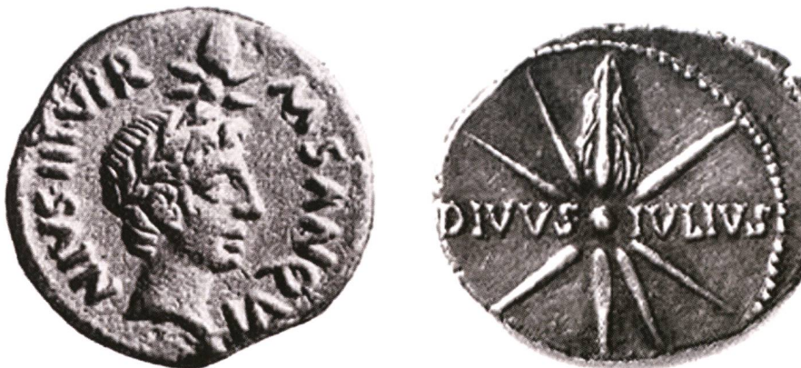
Abbildung 5: Vorder- und Rückseite eines römischen Denars: Caesar und Komet. (Quelle: [6])

Falls diese Geschichte stimmt und der kommende Novemberkomet ISON wirklich hell sichtbar wird, so