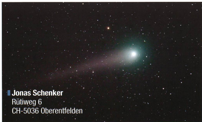
■ Jonas Schenker Rütiweg 6 CH-5036 Oberentfelden