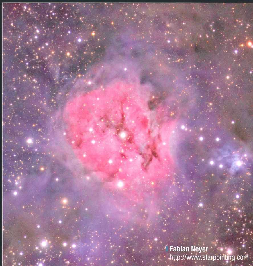
Abbildung 3 (unten rechts): In der Ausschnittvergrößerung ist das im Text beschriebene Herbig-Haro-Objekt sichtbar.