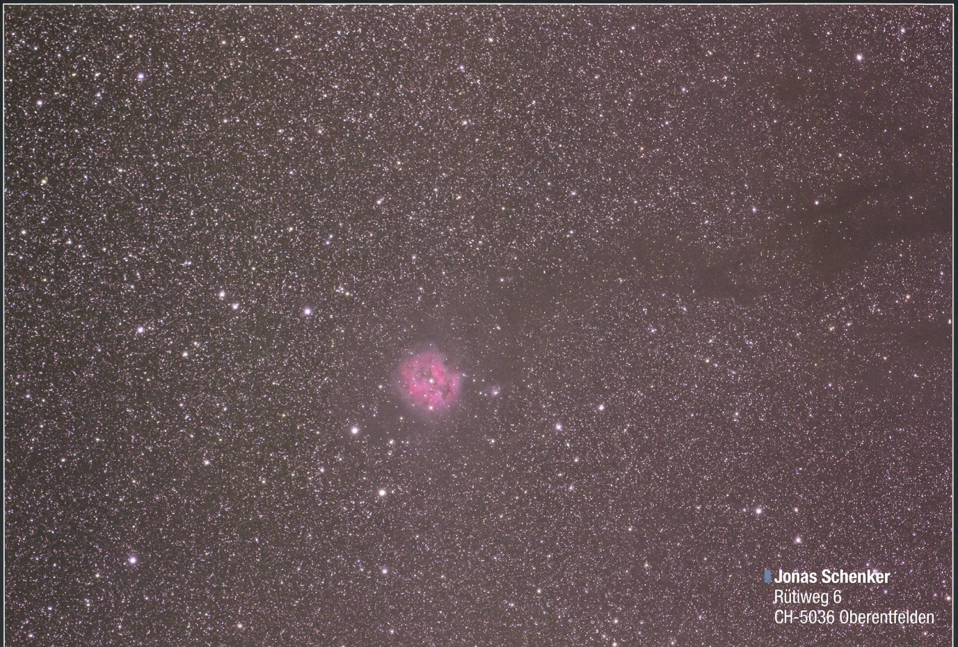
■ Jonas Schenker Rütiweg 6 CH-5036 Oberentfelden