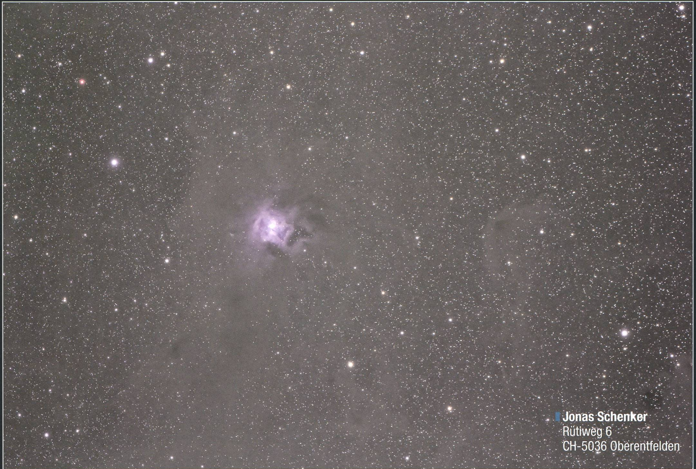
Jonas Schenker Rütiweg 6 CH-5036 Oberentfelden