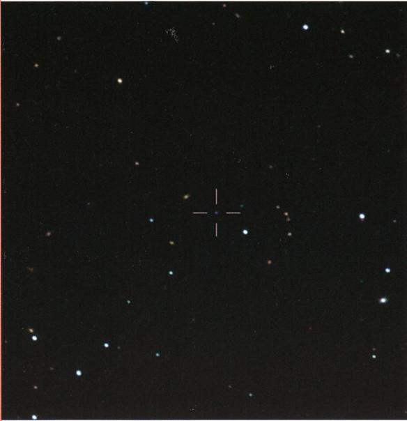
Bild: Dieses Bild des frei beweglichen Planeten CFBDSIR J214947.2-040308.9 im Infraroten wurde mit dem SOFI-Instrument am New Technology Telescope der ESO am La Silla-Observatorium aufgenommen. Der Himmelskörper erscheint als blaues Pünktchen in der Bildmitte und ist mit einem Kreuz markiert. Es handelt sich um das unserem Sonnensystem am nächsten gelegene derartige Objekt. Der Himmelskörper befindet sich nicht in einer Umlaufbahn um einen Stern und reflektiert daher auch kein Sternlicht. Sein schwaches Leuchten kann nur als Wärmestrahlung nachgewiesen werden.

ungebunden an einen Stern durch das Weltall bewegen. Mögliche Kandidaten für solche Objekte waren bereits zuvor entdeckt worden, aber solange ihr Alter nicht bekannt ist, können Astronomen nicht eindeutig feststellen, ob es sich dabei tatsächlich um Planeten oder um sogenannte Braune Zwerge handelt – Sterne, die zu klein geraten sind, um dauerhaft in ihrem Inneren Kernfusion zu betreiben, was letztlich die Energiequelle für das Leuchten eines jeden Sterns darstellt.