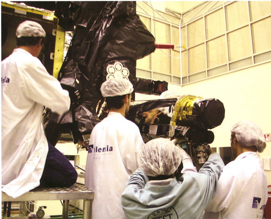
Abbildung 1: Einbau von ROSINA (Rosetta Orbiter Spectrometer for Ion and Neutral Analysis) und des Flugzeitmassenspektrometers RTOF (Reflectron time-of-flight) in Rosetta beim ESTEC (European Space Research and Technology Centre).

Am 2. März 2004 startete eine Ariane V Rakete von französisch-Guyana aus mit grossem Getöse in den wolkenverhangenen Nachthimmel. Damit begann die lange Reise der europäischen Kometenmission Rosetta zum Zielkometen Churyumov-Gerasimenko, eine Reise durchs All und gleichzeitig eine Reise zurück zu unserem Ursprung. Wir Berner Forscher nahmen mit einem lachenden und einem weinenden Auge Abschied von unserer ROSINA (Rosetta Orbiter Sensor for