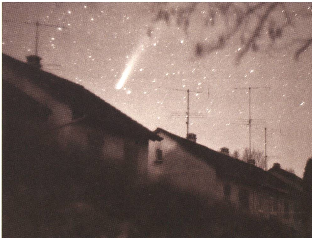
Abbildung 3: Komet Benett im Jahr 1970.

Leiter der Sternwarte Eschenberg Breitenstrasse 2 CH-8542 Wiesendangen