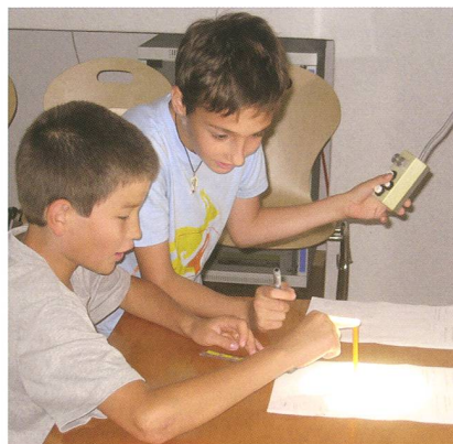
Abbildung 2: Zeichnen der Sonnenflecken am Heliostaten der Sternwarte Bülach.

20:30 Uhr ist meistens für eine Viertelstunde Pause, danach geht es weiter. Gegen 22:00 Uhr ist dann leider meistens Schluss. Das Team der Sternwarte Bülach ist nett und