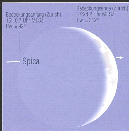
Abbildung 1: Die Spica-Bedeckung am frühen Abend des 8. Septembers 2013. (Grafik: Thomas Baer)

Am 9. September 2013 hat die Mondsichel zu Saturn aufgeschlossen und passiert ihn südlich. Jupiter passiert am 15. September 2013 gegen 06:21 Uhr MESZ in nur 20" nördlichem Abstand den +7.8 mag hellen Fixstern SAO 79126, ein nicht alltägliches Ereignis, das sich Astrofotografen nicht entgehen lassen sollten!