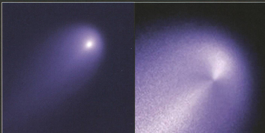
Abbildung 3: Das Hubble Space Teleskop HST fotografierte den Kometen C/2012 S1 ISON am 10. April 2013. Das Kontrast verstärkte Bild rechts zeigt, wie Staub in einer gewaltigen Fontäne vom rund 5 km grossen Kern in den Raum stiebt.

Was Komet ISON bislang ausgezeichnete, war seine aussergewöhnliche Staubproduktion und Schweifentwicklung jenseits der Jupiterbahn. Dies war auch bei Komet Hale-Bopp seinerzeit der Fall. Die Bilder des Hubble-Weltraumteleskops am 10. April 2013 zeigen eindrücklich, wie ISON ausgast (Abb. 3). Ganz deutlich ist auch der Staubschweif zu sehen. Natürlich ist es noch ein weiter Weg bis zum Perihel am 28. November 2013 und nach wie vor ist völlig ungewiss, was mit ISON in unmittelbarer Sonnennähe dann geschieht. Gut möglich, dass der Komet in Sonnennähe durch hohe Temperaturen und die starken Gezeitenkräfte (Roche-Grenze) zerbricht, wenn er in bloss 1.8 Millionen km Abstand, also nur knapp mehr als einen Sonnendurchmesser, am Zen-