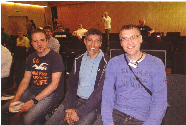
Abbildung 2: Prominenter Einzelgast war der TV-Moderator RANGA YOGESHWAR, hier eingerahmt von ERWIN SCHWAB (rechts) und MARCEL KLEIN, zwei langjährigen und sehr erfahrenen Kleinplaneten-Beobachter aus Deutschland.