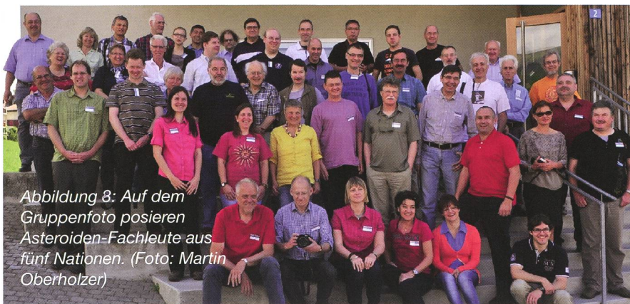
Abbildung 3: Auf dem Gruppenfoto posieren Asteroiden-Fachleute aus fünf Nationen.

sönliche Erfahrungen aus einem eigenen Projekt in Südfrankreich, das er gemeinsam mit Freunden realisiert hat – so schneidet die Remote-Lösung, rein wirtschaftlich betrachtet, erstaunlich gut ab: Für eine Beobachtungsstunde mit dem professionellen 820 mm-Teleskop in Südfrankreich werden 240 Euro fällig. Eine Stunde auf einem 305 mm-Teleskop kostet lediglich 60 Euro. Dabei stehen die beiden Remote-Teleskope an einem wirklich dunklen Beobachtungsort mit guten Luftverhältnissen.