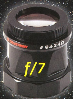
Bildgebener Reducer 0,7x, leuchtet auch Vollformat vignettierungsfrei aus. Lieferbar für EdgeHD1100 und 1400.

Fotografieren Sie Deep-Sky-Objekte im Primärfokus mit einer CCD- oder DSLR-Kamera und dem EdgeHD T-Adapter, oder Planeten mit der neuen NexImage 5 Kamera und einer der neuen 2x oder 3x X-Cel Barlow-Linsen.