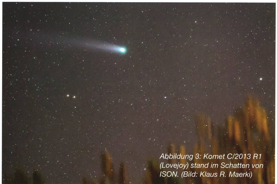
Abbildung 3: Komet C/2013 R1 (Lovejoy) stand im Schatten von ISON.