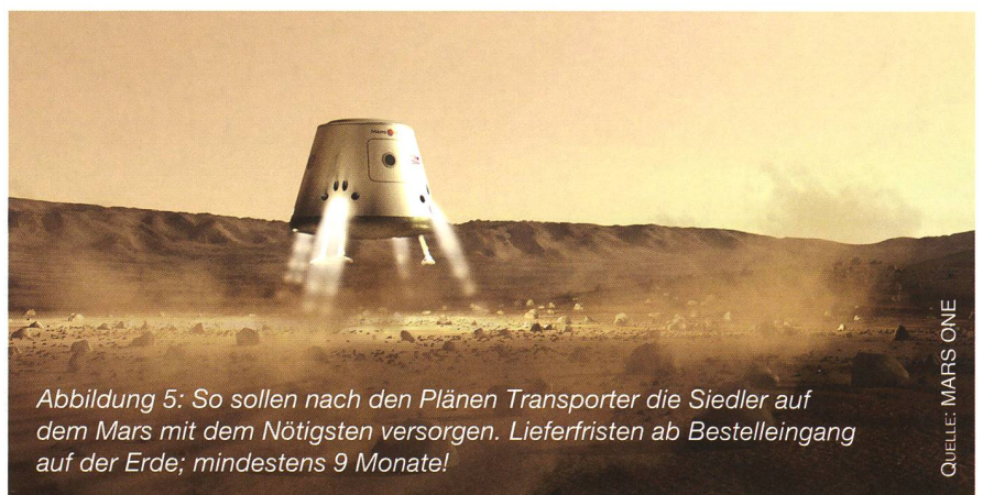
Abbildung 5: So sollen nach den Plänen Transporter die Siedler auf dem Mars mit dem Nötigsten versorgen. Lieferfristen ab Bestelleingang auf der Erde; mindestens 9 Monate!

Die Erforschung des Mars bietet der Wissenschaft und der Menschheit viel zu viele einmalige Chancen, um sie durch eine Hauruck-Aktion zu gefährden. Leider aber verharren die staatlichen Raumfahrt-Organisationen des Westens, aus Mangel