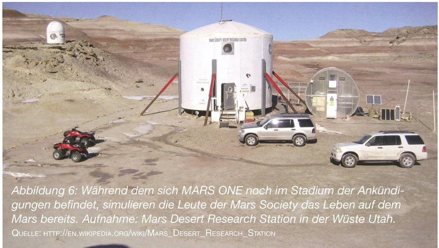
Abbildung 6: Während dem sich MARS ONE noch im Stadium der Ankündigungen befindet, simulieren die Leute der Mars Society das Leben auf dem Mars bereits. Aufnahme: Mars Desert Research Station in der Wüste Utah.

Zubrin war einer der ersten Ingenieure, die schnell die fundamentalen