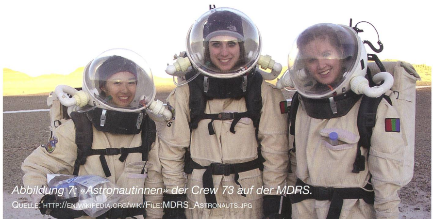
Abbildung 7: «Astronautinnen» der Crew 73 auf der MDRS.

Kirchweg 1 CH-4532 Feldbrunnen hj.geiger@mac.com www.astrobiologie.ch