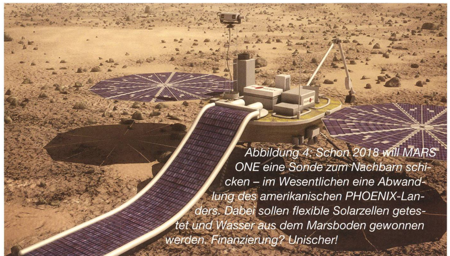
Abbildung 4: Schon 2018 will MARS ONE eine Sonde zum Nachbarn schicken – im Wesentlichen eine Abwandlung des amerikanischen PHOENIX-Landers. Dabei sollen flexible Solarzellen getestet und Wasser aus dem Marsboden gewonnen werden. Finanzierung? Unischer!

Was aber, wenn das Interesse an diesem überdimensionierten Big-Brother-Nachahmer abflauen sollte? Eine Entwicklung, die wohl schneller eintreten dürfte, als den Organisatoren lieb ist. Denn irgendwann wird sich das Massenpubli-