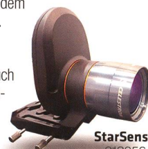
StarSense 919256 Fr. 519.-

Die AVX verfügt neben einem RS232-Anschluss auch über einen Autoguiding-Eingang und zwei AUX-Anschlüsse. Hier können Sie zusätzliche, separat erhältliche Erweiterungsmodule anschliessen – zum Beispiel das SkyQ Link Modul für die Steuerung über WLAN mit iPhone/iPad/Windows-PC oder das StarSense-Modul , mit dem die Montierung ihre Referenzsterne automatisch anfährt und perfekt zentriert.