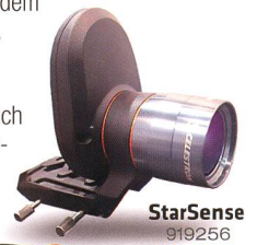
StarSense 919256 Fr. 519.-

Die AVX verfügt neben einem RS232-Anschluss auch über einen Autoguider-Eingang und zwei AUX-Anschlüsse. Hier können Sie zusätzliche, separat erhältliche Erweiterungsmodule anschliessen – zum Beispiel das SkyQ Link Modul für die Steuerung über WLAN mit iPhone/iPad/Windows-PC oder das StarSense-Modul , mit dem die Montierung ihre Referenzsterne automatisch anfährt und perfekt zentriert.