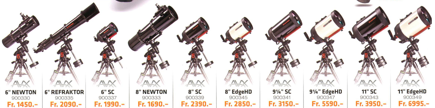
6" NEWTON 900330 Fr. 1450.-