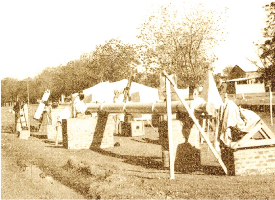
Abbildung 1: Das Instrumentarium des Expeditionsteams um MAX WALDMEIER in Khartoum im Februar 1952.

1952 nach Khartoum. WALDMEIER schreibt in seinem Bericht: «Im Juni 1950 bewilligte der Senat der Schweizerischen Naturforschenden Gesellschaft auf Grund des vom Verfasser eingereichten Exposés, welches über Ziel und Dauer der Reise, über Personalbestand, das wissenschaftliche Programm, das mitzuführende Instrumentarium und das Budget orientierte, aus dem Zentralfonds den nachgesuchten Betrag. Es war aber erwünscht, der Expedition einen weiter gespannten Rahmen zu geben, wozu die finanzielle Basis erweitert werden mußte. Dies wurde ermöglicht durch Beiträge der Regierungen der Kantone Zürich, Bern, Luzern, Uri, Solothurn, Baselstadt, Baselland, Schaffhausen, Aargau, Thurgau und Neuenburg, der Dr.-HERMANN-STOLL-Stiftung sowie zahlreicher privater Firmen und Gesellschaften.» [1]