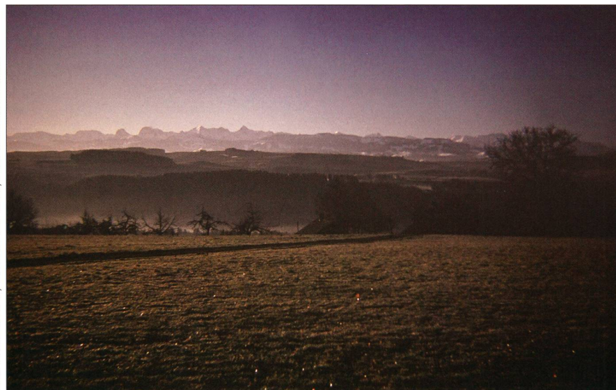
15. FEBRUAR 1961, NEUENEGG IM SENSETAL