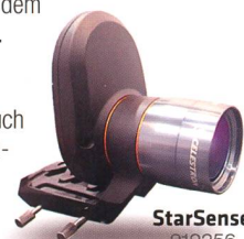
StarSense 919256 Fr. 519.-

Die AVX verfügt neben einem RS232-Anschluss auch über einen Autoguider-Eingang und zwei AUX-Anschlüsse. Hier können Sie zusätzliche, separat erhältliche Erweiterungsmodule anschliessen – zum Beispiel das SkyQ Link Modul für die Steuerung über WLAN mit iPhone/iPad/Windows-PC oder das StarSense-Modul , mit dem die Montierung ihre Referenzsterne automatisch anfährt und perfekt zentriert.