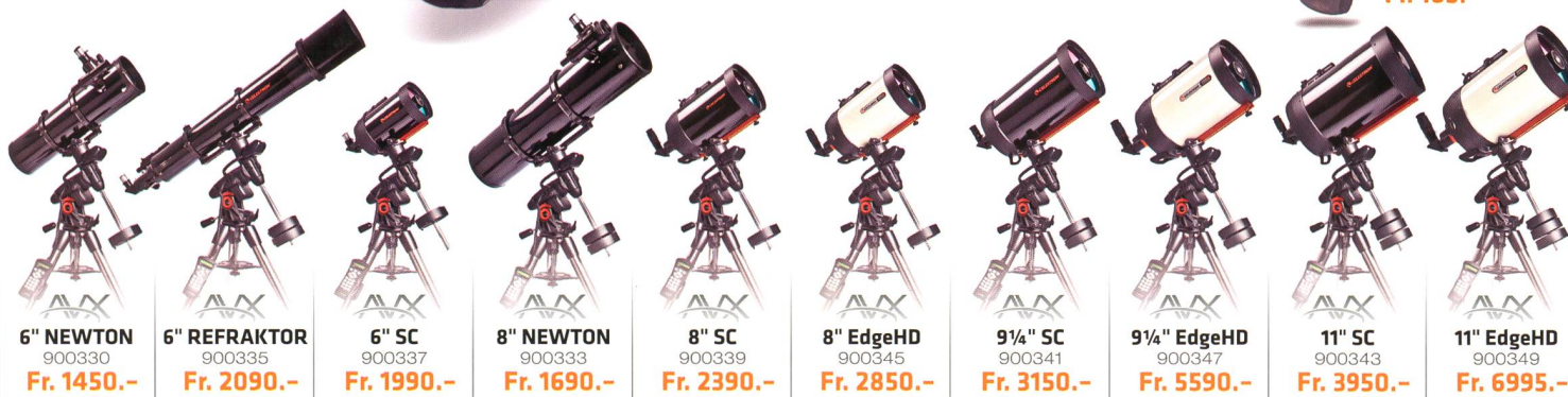
6" NEWTON 900330 Fr. 1450.-