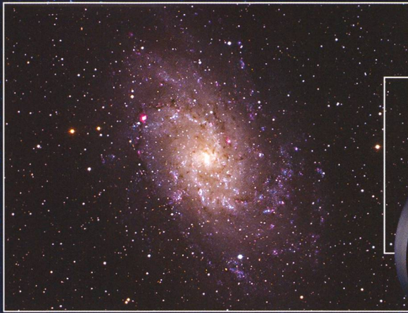
M33 - Spiral Galaxie (Ausschnitt) © Andre Paquette. Aufgenommen mit CGE Pro 1400 HD und Nightscape (abgebildet).