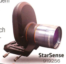
StarSense 919256 Fr. 519.-

► Vielseitig ausbaubar Die AVX verfügt neben einem RS232-Anschluss auch über einen Autoguiding-Eingang und zwei AUX-Anschlüsse. Hier können Sie zusätzliche, separat erhältliche Erweiterungsmodule anschliessen – zum Beispiel das SkyQ Link Modul für die Steuerung über WLAN mit iPhone/iPad/Windows-PC oder das StarSense-Modul , mit dem die Montierung ihre Referenzsterne automatisch anfährt und perfekt zentriert.