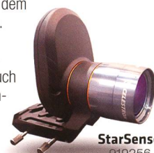
StarSense 919256 Fr. 519.-

Die AVX verfügt neben einem RS232-Anschluss auch über einen Autoguiding-Eingang und zwei AUX-Anschlüsse. Hier können Sie zusätzliche, separat erhältliche Erweiterungsmodule anschliessen – zum Beispiel das SkyQ Link Modul für die Steuerung über WLAN mit iPhone/iPad/Windows-PC oder das StarSense-Modul , mit dem die Montierung ihre Referenzsterne automatisch anfährt und perfekt zentriert.