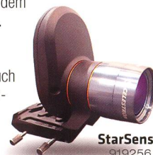
StarSense 919256 Fr. 519.-

Die AVX verfügt neben einem RS232-Anschluss auch über einen Autoguiding-Eingang und zwei AUX-Anschlüsse. Hier können Sie zusätzliche, separat erhältliche Erweiterungsmodule anschliessen – zum Beispiel das SkyQ Link Modul für die Steuerung über WLAN mit iPhone/iPad/Windows-PC oder das StarSense-Modul , mit dem die Montierung ihre Referenzsterne automatisch anfährt und perfekt zentriert.