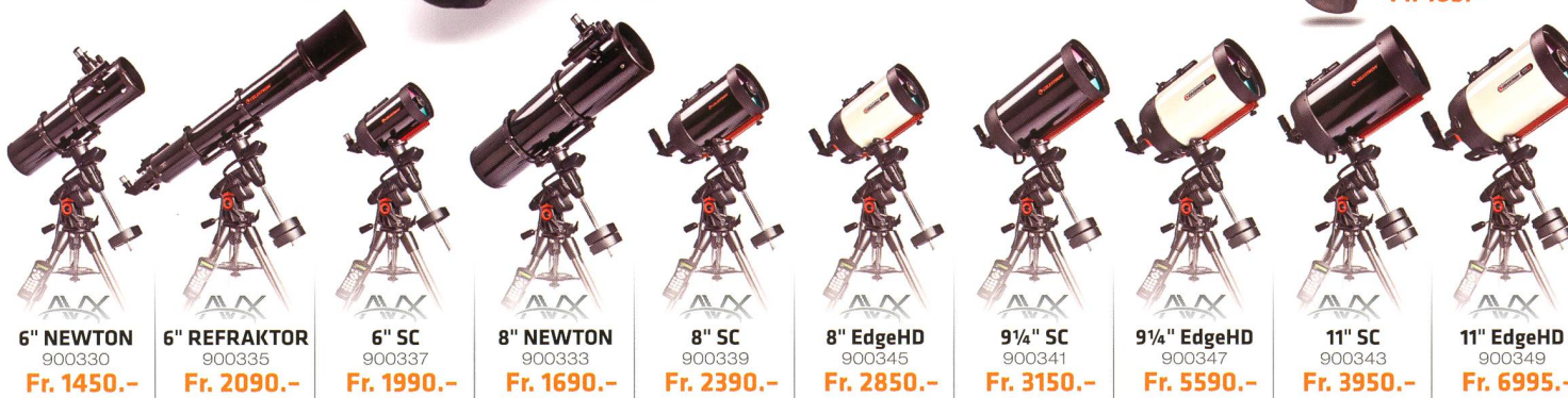
6" NEWTON 900330 Fr. 1450.-