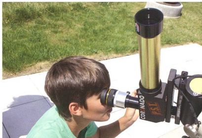
Abbildung 2: Mit dem PST (Coronado) lassen sich die Protuberanzen perfekt beobachten.

gleich zum Start der neuen Woche nach Auffahrt erleben werden. Wer hat, darf auch sein eigenes Teleskop mitbringen. Wir basteln für den Merkurtransit Sonnenfilter aus Mylarfolie.