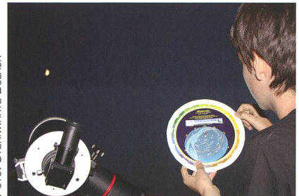
Abbildung 4: Die ORION-Sternkarte ist leicht zu bedienen. Mit ihr kannst du die Sternbilder leicht identifizieren.

Anmeldung bis spätestens 30. April 2016 unter: