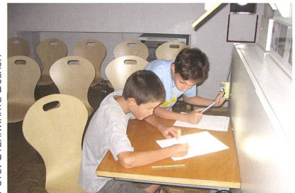
Abbildung 3: Sonnenbeobachtung am Heliostaten.