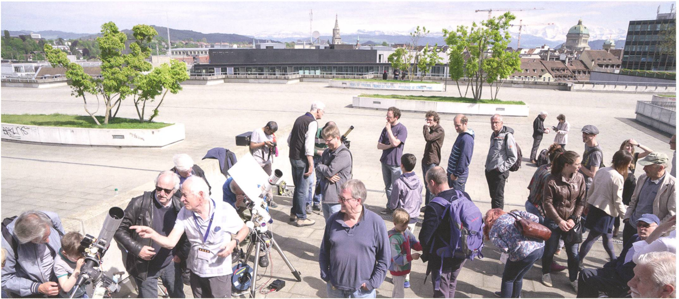
Abbildung 2: Dachterasse mit Bern im Hintergrund: Das ExWi ist ideal gelegen oberhalb des Bahnhofs. Mit dem Bundeshaus und dem Münster im Hintergrund sowie dem unverkennbaren Bergpanorama von Bern war das Warten kurzweilig.

wortlich ist. Wie bei Rosetta müssen wir uns aber nach dem Start noch in Geduld üben: Erste Bilder gibt es frühestens ab 2024. Besonders spannend wird das Ende der langen Reise. Ein schwieriges Bremsmanöver steht der Sonde be-