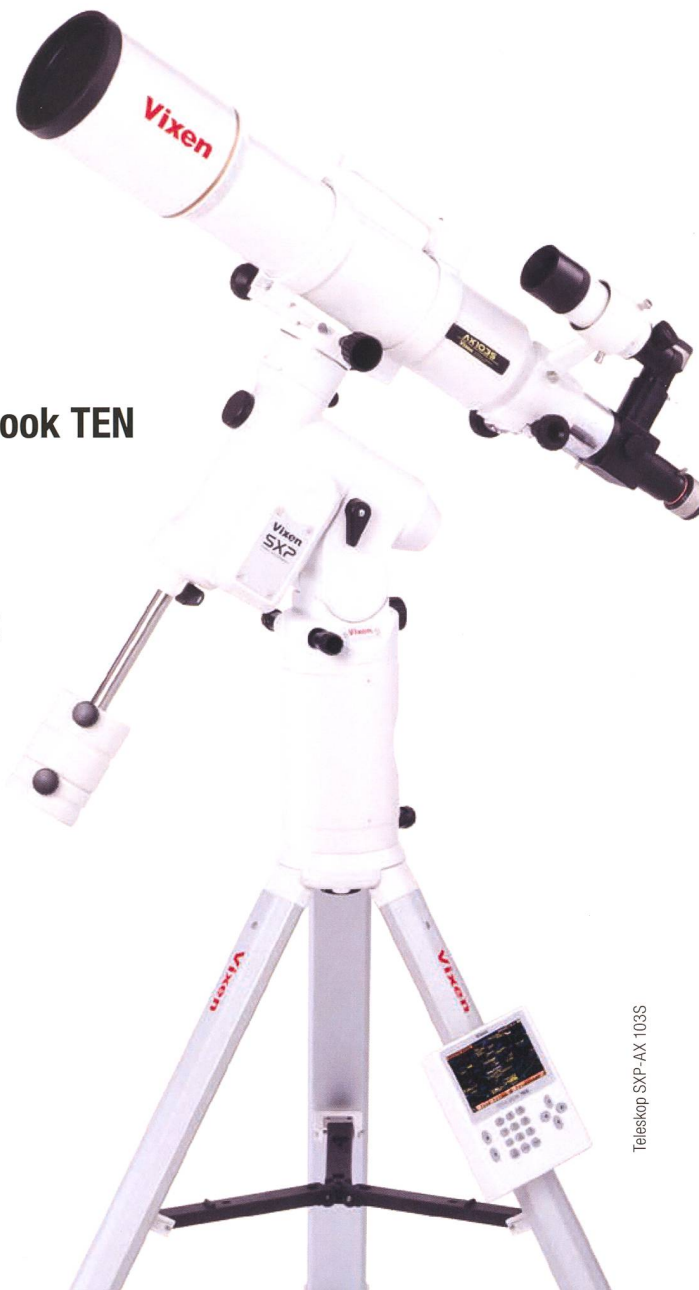
Teleskop SXP-AX 103S

VIXEN Fernrohr-Optiken: Achromatische Refraktoren – Apochromatische Refraktoren – Maksutov Cassegrain – Catadioptrische Systeme VISAC – Newton Reflektoren.