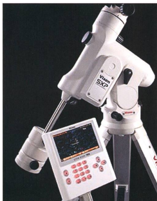
Parallaktische Montierung SXP mit Starbook TEN