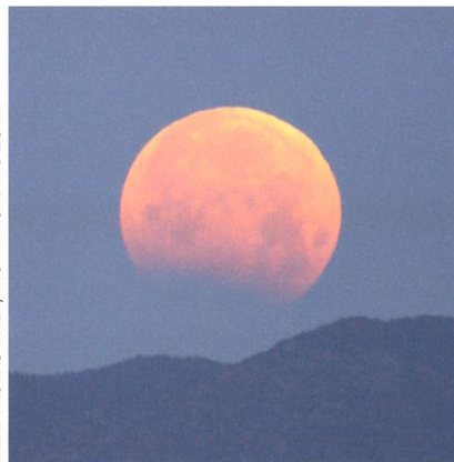
MONDFINSTERNIS 2012

Auch im Sommer zeigt sich Merkur in der langen Abenddämmerung.