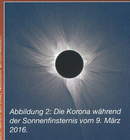
Abbildung 2: Die Korona während der Sonnenfinsternis vom 9. März 2016.