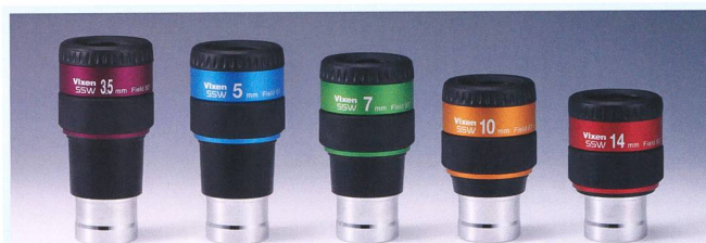
NEU: Vixen Okulare SSW 83° Ø 1 1/4", 31.7mm

Bildschärfe: Extrem scharfe Sternabbildungen über das gesamte Gesichtsfeld.