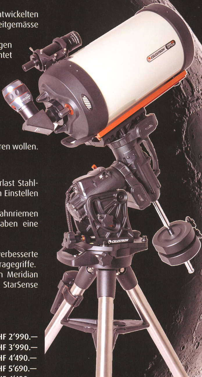
▲ CGX 9.25" Edge HD Kit