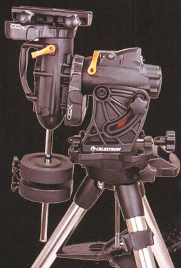
◀ CGX Mount