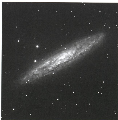
Sculptor-Galaxie (H V-1)