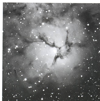
Trifid-Nebel (H V-10, 11, 12)